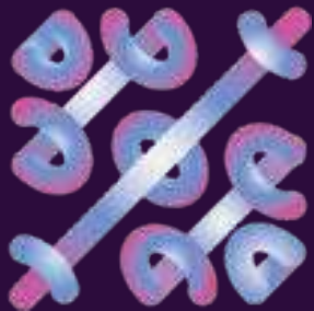
La Collégiale fait son Cirque !