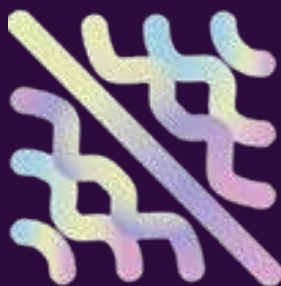
Stochelo Rosenberg Trio